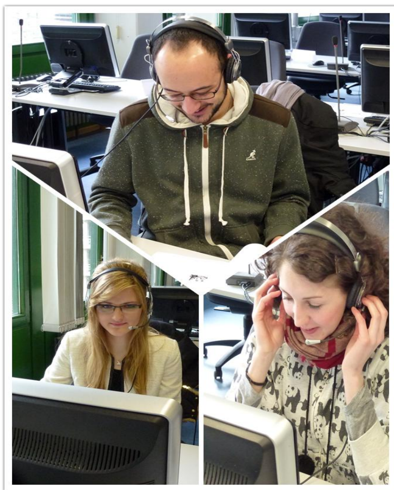
轻松应考的可爱考生

为了保证考试的顺利进行，杜塞孔院做了精心的考前准备和部署。从考前指导学生网上报名及缴费、准考证的生成及发放到考场教室的协调等，孔院都做了精心的安排。开考后，监考老师向学生详细讲解答题规则并耐心解答学生疑问，为考生创造了良好的考场环境。考试期间，所有考场也均安排了一位德国监考人员，这样也保证了考试的顺利进行。在全体监考人员的努力下，HSKK 考试在紧张而又愉快的气氛中圆满结束。